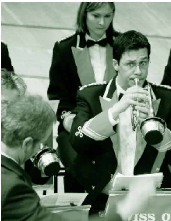
Konzentrierte Blicke bei der Oberaargauer Brass Band (Rang 3).

die Juroren nicht einfacher; ausgewiesenen Experten sollte man sie aber zutrauen, auch wenn man selbst hinterher nicht auf Platz 1 landet. Und dass sich Montreux und Luzern im Sinne einer Ergänzung die Aufgaben mit oder ohne Absicht geteilt haben, hat durchaus etwas für sich: Der Schweizerische Brass Band Wettbewerb konzentriert sich auf Originalkompositionen, gibt dafür bei einheimischen und ausländischen Komponisten immer wieder neue Werke in Auftrag und aktualisiert damit auch das Repertoire. Der Wettbewerb richtet sich so primär an die Spezialisten, an die teilnehmenden Bands und ihre Fans. Der Swiss