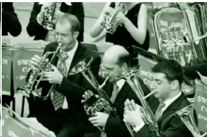
Punktgleich auf Rang 7: Entlebucher Brass Band (links) und Brass Band Luzerner Hinterland (rechts).

hat, als er einige Jahre seines Lebens in Tribschen zugebracht hat.